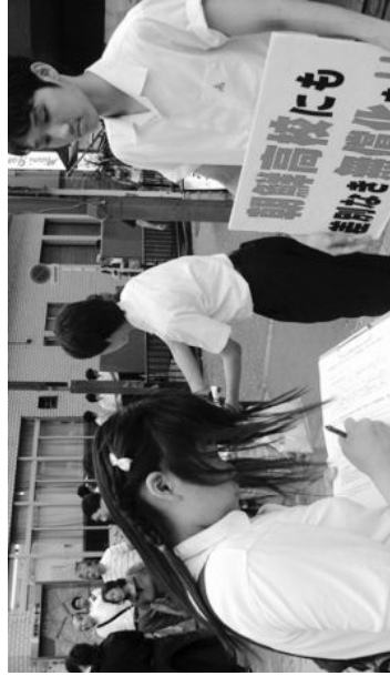
無償化適用を求め街頭宣伝を行う朝鮮学校生徒たち