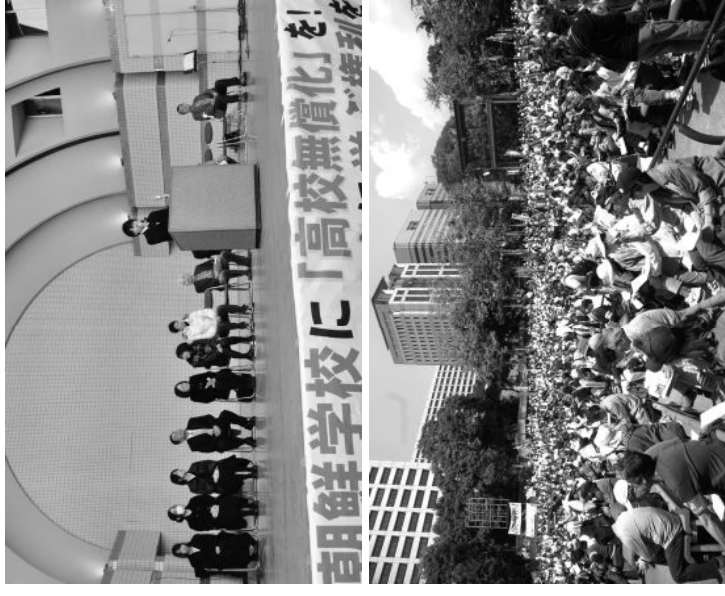
無償化を訴える大集会

この間、朝鮮高校の在学生のみなならず、約1200名の卒業生たちにも就学支援金が支給されていません。また、「高校無償化」制度施行に伴う、扶養控除の見直し(16～18歳までの特定扶養親族に対する扶養控除の上乗せ部分を廃止)により、朝鮮学校の保護者たちは「2重の負担」を強いられています。