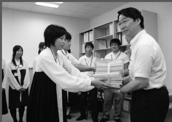
文部科学省への要請を行う朝鮮高校生徒たち

…問われているのは、北朝鮮の振る舞いでない。日本で生きる子供たちを等しく処遇できない、私たち日本人自身の姿勢である。高校無償化法の不適用は、朝鮮学校の生徒の尊厳を傷つけるとともに、日本の国際的信頼を損ねている。